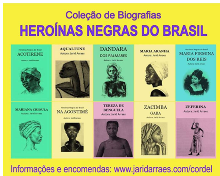
Figura 2 – Imagem com dez capas de seus cordéis na página de Facebook de Jarid Arraes.

ainda mais as mensagens. As histórias e imagens contidas neles, contudo, extrapolaram as páginas sequenciadas e numeradas para uma nova materialidade lúdica: um jogo de cartas.